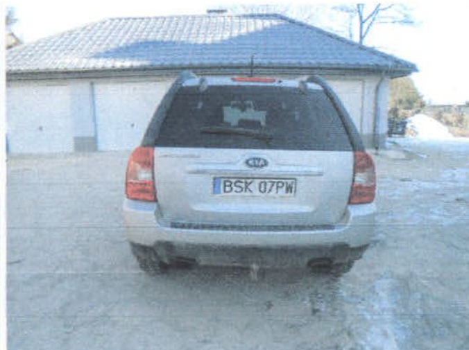
DSC04436 Widok ogólny

RZECZOZNAWCA TECHNIKI SAMOCHODOWEJ, MASZYN I URZĄDZEŃ Lech Gremza NIP 545-101-30-42, REGON 050648950 16-100 Sokołka, ul. Polna 37 tel. 605302787