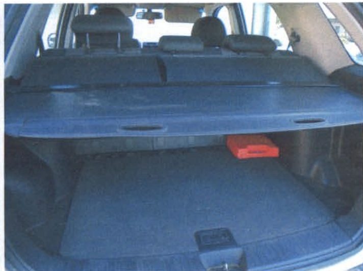
DSC04459 Poszycie bagażnika