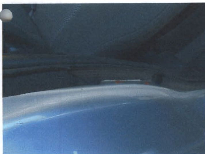
DSC04457 Rozerwana uszczelka drzwi tylnych prawych