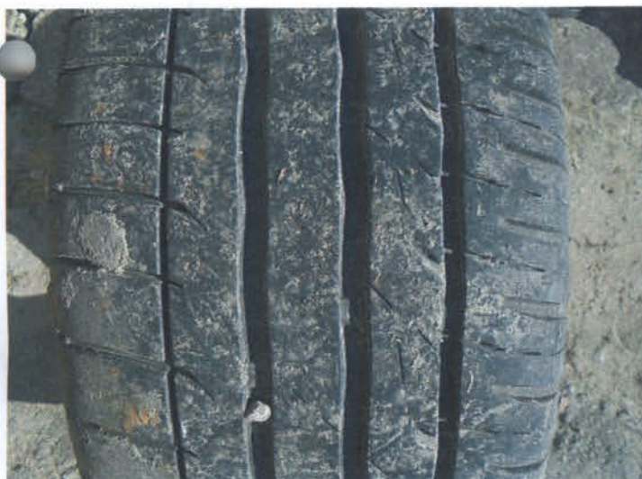
DSC04461 Opona letnia