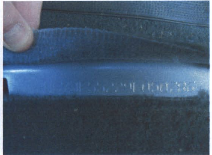
DSC04452 Numer VIN pod przednim prawym fotelem