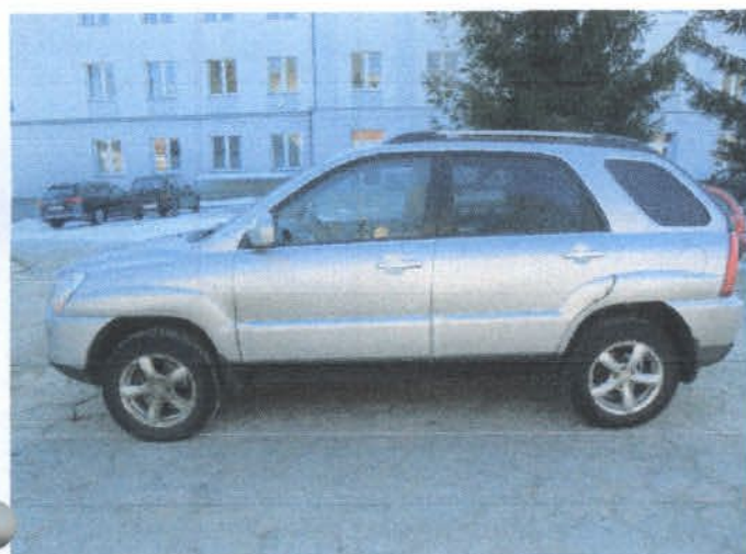
DSC04434 Widok ogólny