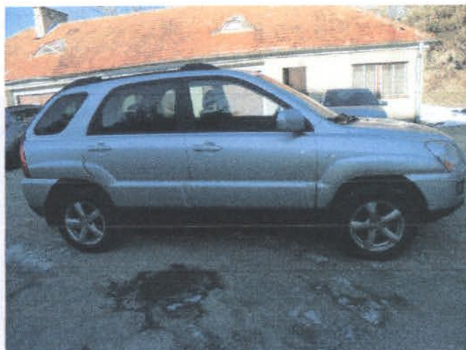
DSC04433 Widok ogólny