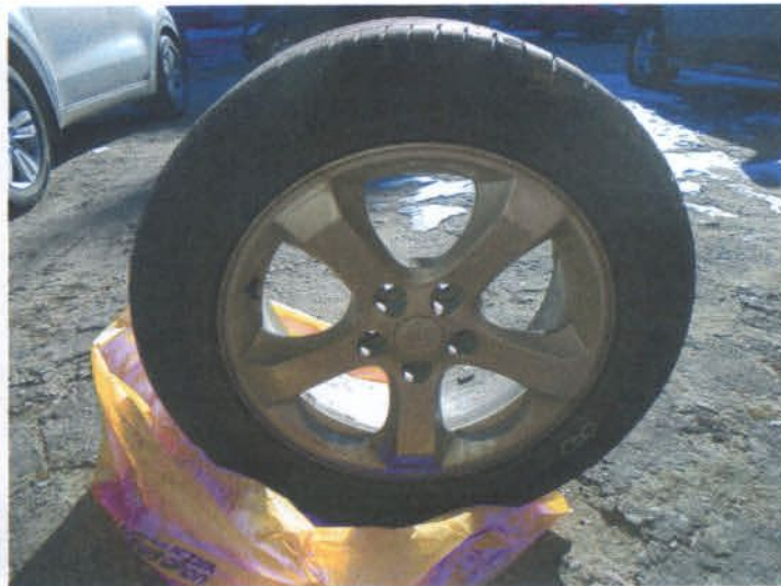
DSC04460 Komplet kół z oponami letnimi