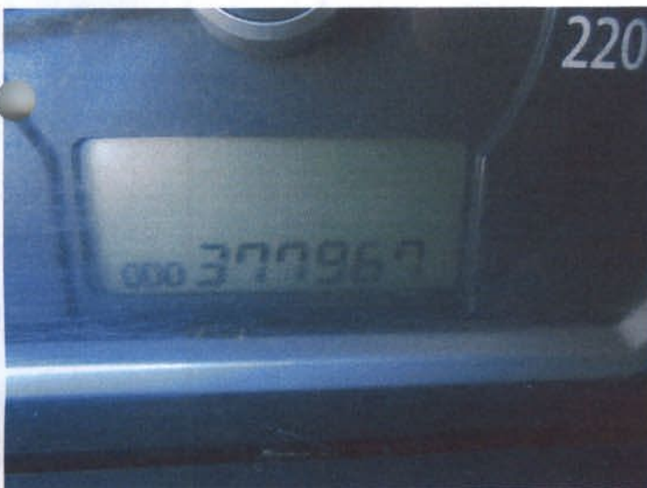
DSC04441 Stan licznika