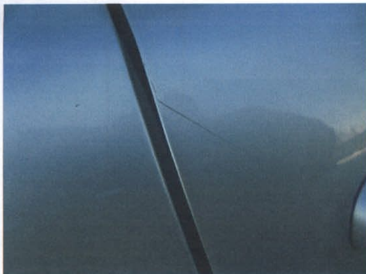
DSC04458 Drobne zarysowania lakieru