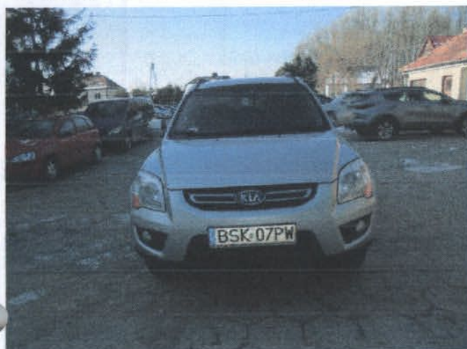
DSC04432 Widok ogólny