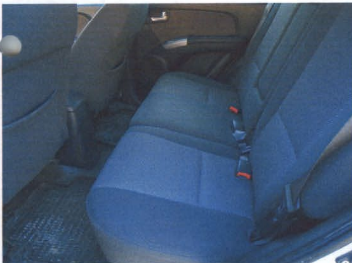
DSC04439 Poszycie kanapy